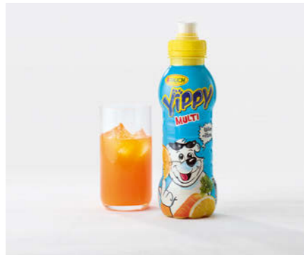
Rauch Yippy Kids Multivitamin 330ml

Erfrischung für jedes Alter Refreshment for all ages