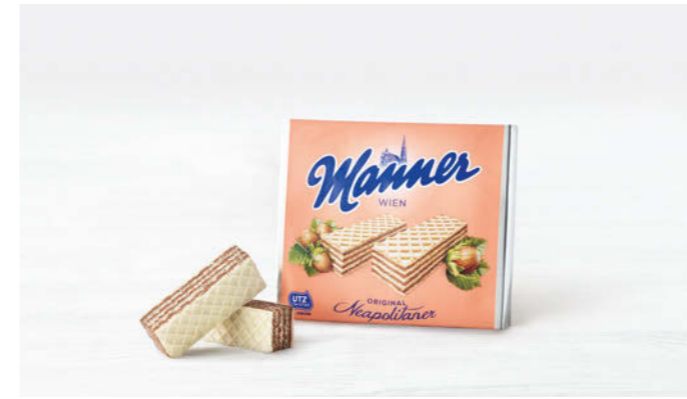
Manner Original Neapolitaner Schnitten 75g

Mit feinsten Haselnuss-Kakaocreme With delicate hazelnut cocoa cream