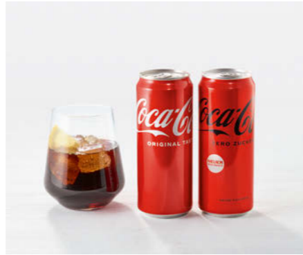
Coca-Cola / Coca-Cola Zero 330ml