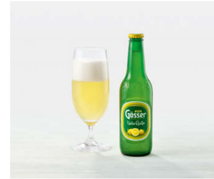
Gösser Natur Radler 330ml

Österr. Radler mit natürlichem Zitronensaft Austrian radler with natural lemon juice