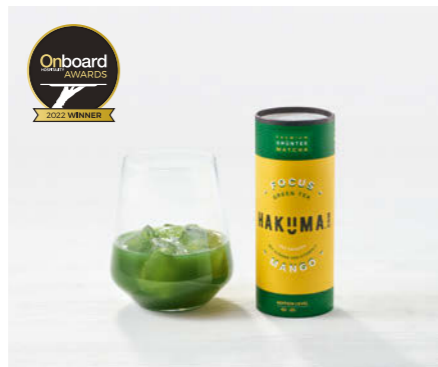
Hakuma Premium Iced Tea 235ml Focus Green Tea Matcha

Dein natürlicher Boost aus Österreich Your natural Boost from Austria