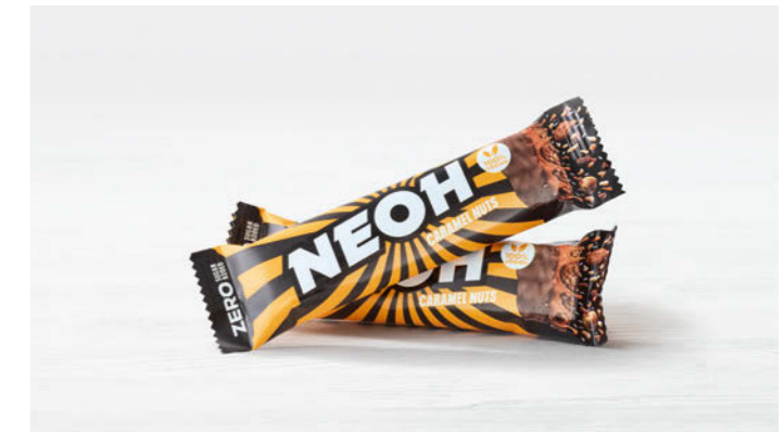
Neoh Caramel Nuts Crunch 28g

Veganer Schoko-Nussriegel ohne zugesetzten Zucker Vegan chocolate nut bar without added sugar