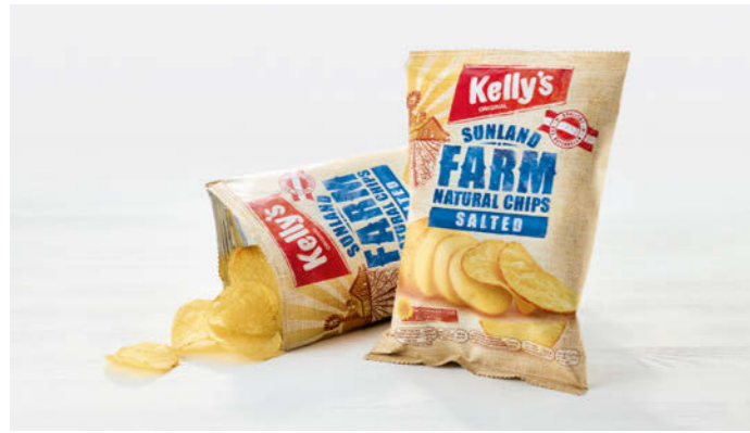
Kelly's Sunland Farm Chips Salted 30g

100 % österreichische Erdäpfel 100 % Austrian Potatoes