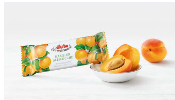
Darbo Fruchtschnitte 40g

Fruchtiger Snack mit Rosenmarillen, Haferflocken und Mandeln Fruity snack with rose-apricots, oats and almonds