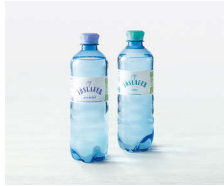
Vöslauer Mineralwasser 500ml

Stilles / Prickelndes Wasser aus Österreich Still / Sparkling water from Austria