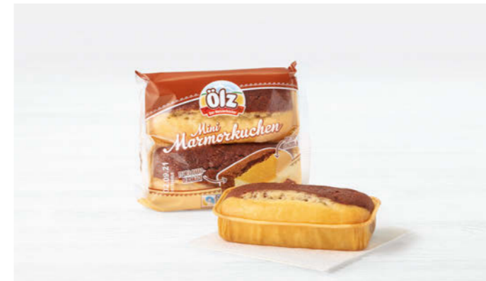
Mini Marmor Kuchen 2er 130g

100 % Fairtrade zertifizierter Kakao 100 % Fairtrade certified cacao