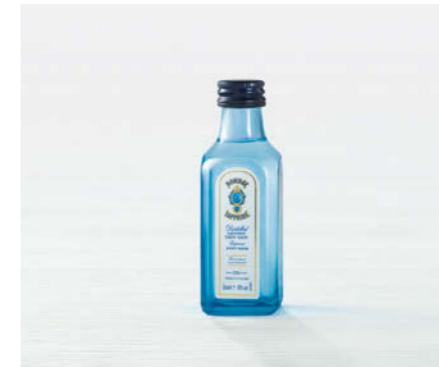
Bombay Sapphire Gin 5cl