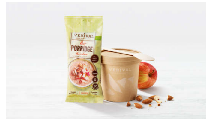
Verival Bio Porridge Bircher 45g

Warmer Bio Porridge handgefertigt in Tirol Warm organic Porridge handmade in Tyrol