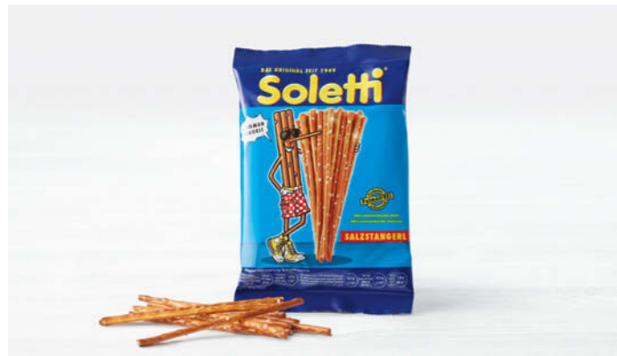
Soletti Salzstangerl 40g

100 % Österreich – immer dabei! 100 % Austria – wherever you go!