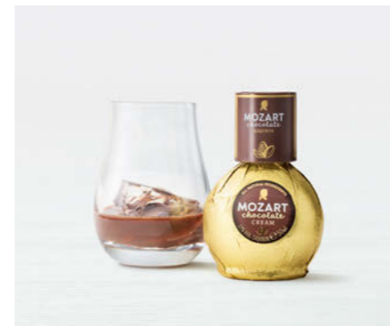
Premium Mozart Chocolate Liqueur 5cl