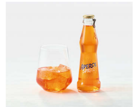
Aperol Spritz 175ml