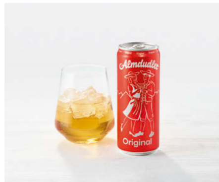
Almdudler Dose 330ml

Österreichs beliebteste Kräuterlimonade Austria's favourite herbal lemonade