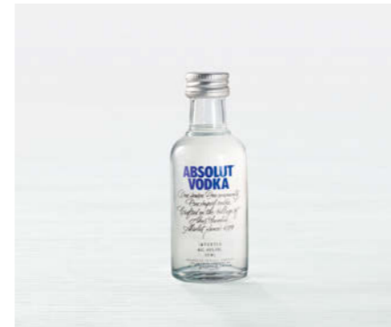
Absolut Vodka 5cl