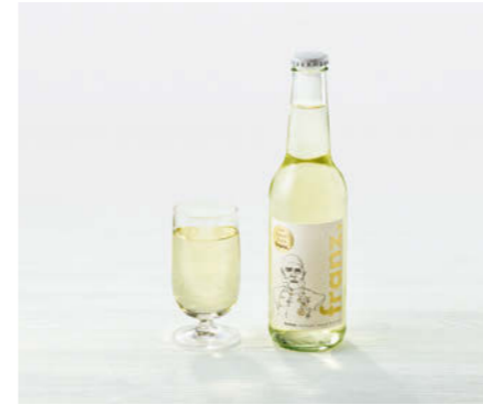
Franz & Sissi franz. 330ml