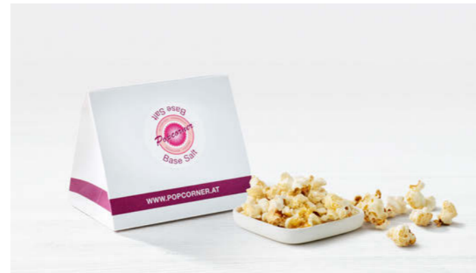
Popcorner Organic Popcorn 25g

Popcorn aus Wien mit Meersalz und Kokosöl Popcorn from Vienna with sea salt and coconut oil