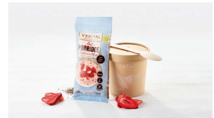
Verival Bio Porridge Erdbeer-Chia 45g

Warmer Bio Porridge handgefertigt in Tirol Warm organic Porridge handmade in Tyrol