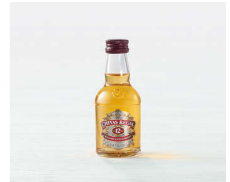
Chivas Regal Whisky 5cl