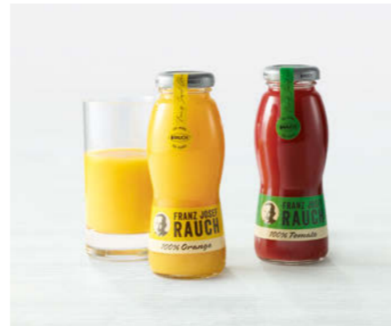
Franz Josef Rauch Säfte 200ml

Orangensaft / Tomatensaft Orange juice / tomato juice