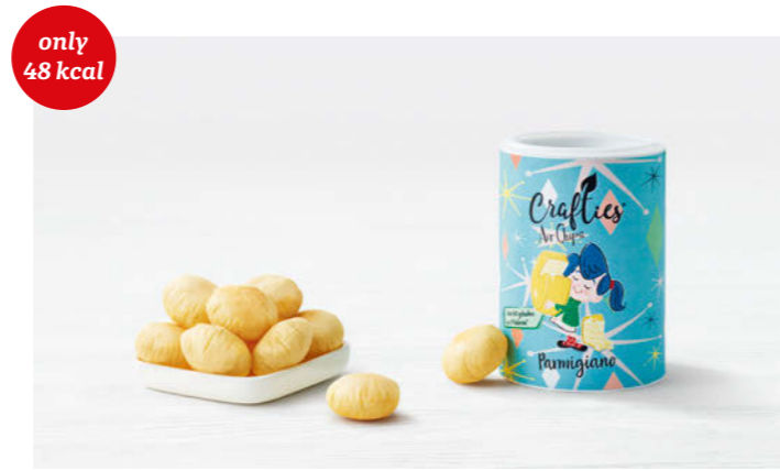
Crafties Air Chips Parmigiano 30g

Knackige, kalorienreduzierte Erdäpfelchips mit Parmesan Crispy, low-calorie potato chips with parmesan