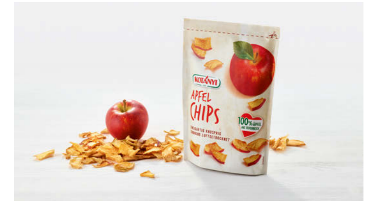
Kotanyi Apfel Chips 40g

Knusprig getrocknete österreichische Äpfel Crunchy dried Austrian apple