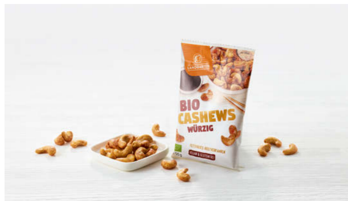
Landgarten Bio Cashews würzig 50g

Milde Cashews mit japanischer Tamari-Sauce Mild cashews with Japanese Tamari sauce