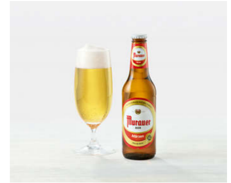
Murauer Märzen Bier 330ml