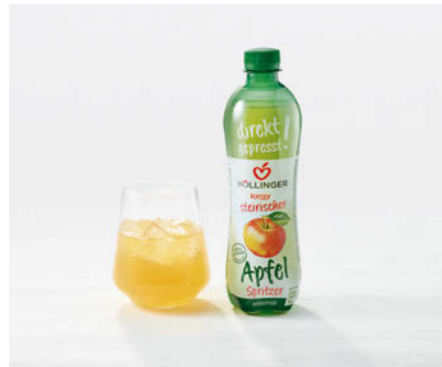
Höllinger Steirischer Apfelspritzer 500ml

Naturtrüber, steirischer Direktsaft gespritzt Naturally styrian Apple Spritz directly pressed