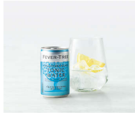
Fever Tree Mediterranean Tonic 150ml

Mit natürlich gewonnenen Zutaten With naturally sourced ingredients